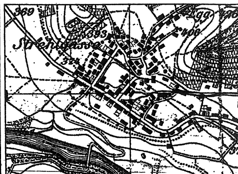
1944, nach Karte 1 : 25 000. Der Verlauf des Etters ist angedeutet. Der Dorfbach läuft noch stückweise offen. Neubauten meist in unproduktiven Strassenbördern, z.B. Badenerstrasse, Egg.